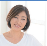
特別講演 田中ウルヴェ 京 (メンタルトレーナー／五輪メダリスト／IOCマーケティング委員／ 慶應義塾大学大学院 システムデザイン・マネジメント研究科)