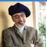
特別講演 伊藤 輝夫 (テリー伊藤：慶應義塾大学政策・メディア研究科)